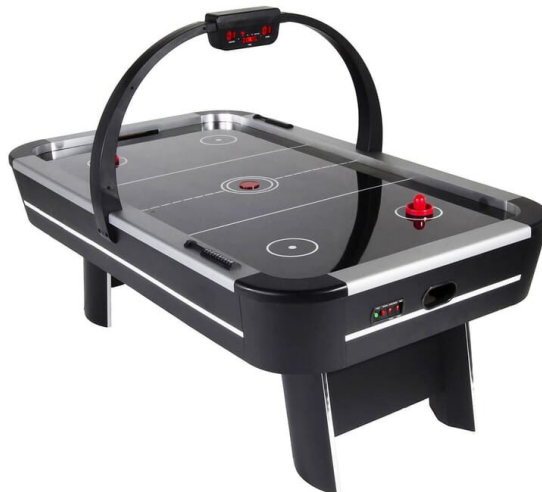
Figure 1. Une table d'Air Hockey

L'air hockey, est un jeu de société qui se joue à deux joueurs. Il a été inventé en 1972 par Bob Lemieux, un amateur de hockey sur glace et ingénieur pour le fabricant de tables de billard Brunswick Billiards. Le jeu a connu un grand succès dès son lancement et il existe un championnat, actif depuis la fin des années 1970. Le disque est maintenu en l'air par le souffle exercé par les petites aérations de la table ( Wikipedia ).